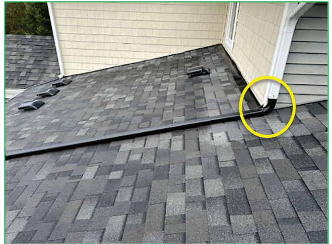
Ejemplos de Canales de Drenaje Cerrados : Conectados a una Bajante (derecha); y Vaciado hace a un Canalón Abajo (izquierda)

Comuníquese con Servicios técnicos de Malarkey si tiene preguntas en el (800) 545-1191 o (503) 283-1191, de 7:00 a.m. a 5:00 p.m., hora del Pacífico, o envíenos un correo electrónico a malarkey.technicalinquiries@holcim.com .