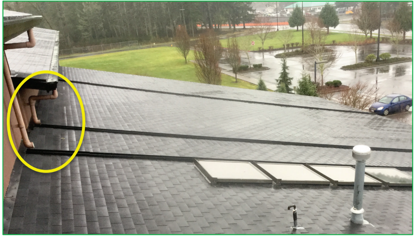
Ejemplos de Canales de Drenaje Abiertos